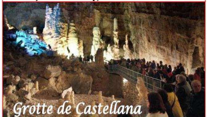
Grotte de Castellana